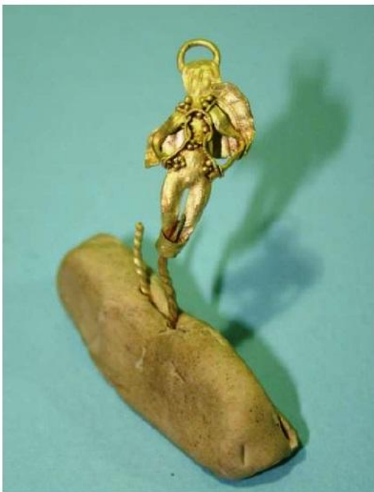
ΑΡΧΑΙΟΛΟΓΙΚΟ ΕΥΡΗΜΑ ΧΡΥΣΟ ΕΝΩΤΙΟ ΠΕΡΙΟΧΗ ΑΚΡΟΒΑΘΡΟΥ Α11